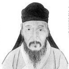
(中華古文明大圖集)

方孝孺，字希直，一字希古，別號遜志，人稱正學先生。寧海（今浙江省寧海縣）人。生於元順帝至正十七年（西元一三五七），卒於明惠帝建文四年（西元一四〇二），年四十六。